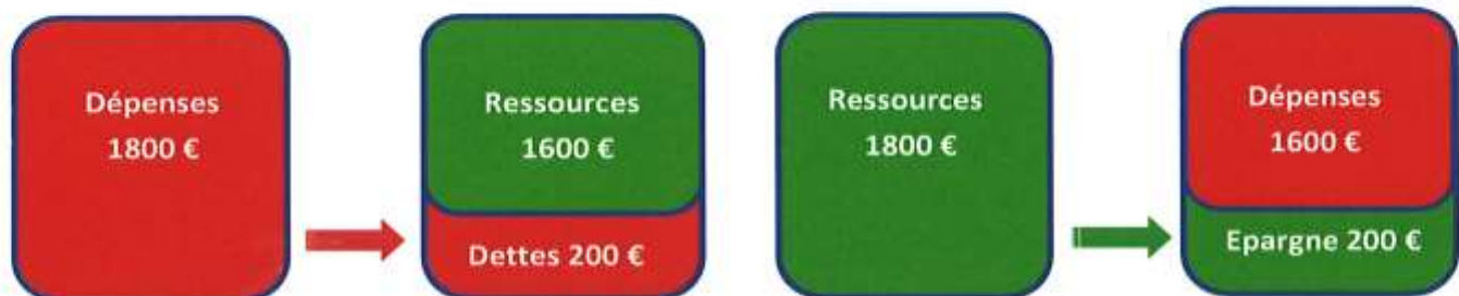
Budget déséquilibré : création de dettes