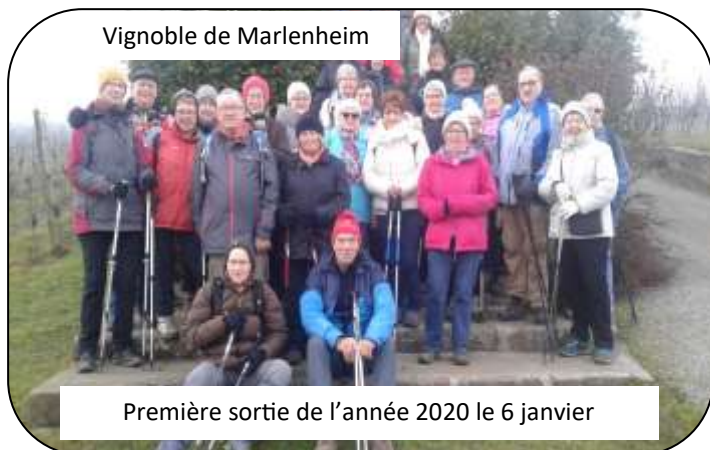
Vignoble de Marlenheim

Première sortie de l'année 2020 le 6 janvier