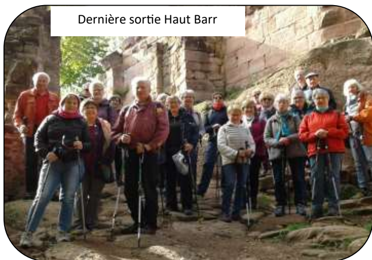
Dernière sortie Haut Barr

EST VENU LE TEMPS DU COVID QUI A RESTREINT LE NOMBRE DE PARTICIPANTS.